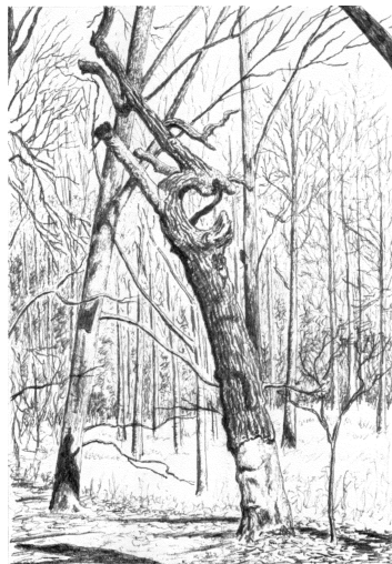
Død egestamme i Baglindet

Another walk takes you down Svalebakken through Forlindet (I) to the old railway, Gl. Ringstedbane, and from there back to Køge town.