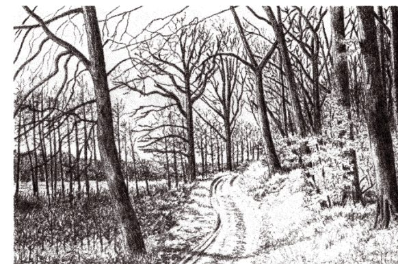
Kildevejen set mod vest

Fra Dannehøj er der en storslået udsigt mod Lellinge og de stejle skrænter til Køge Å.