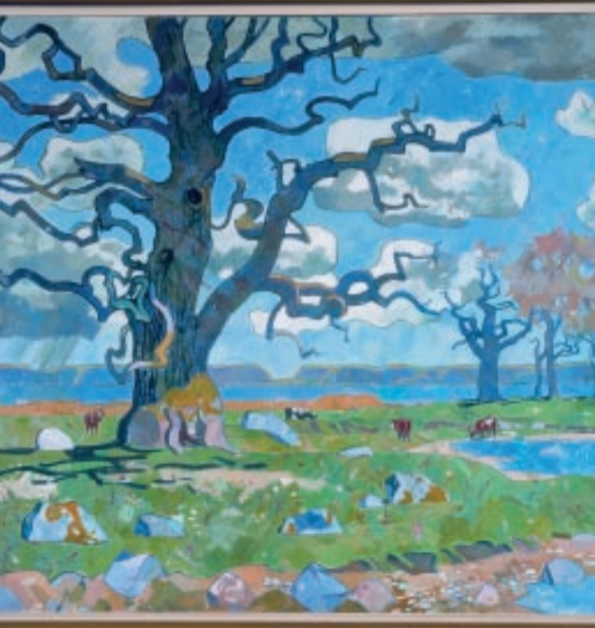
Skejten. Maleri af Olaf Rude. Hænger på Folketingets bagvæg.