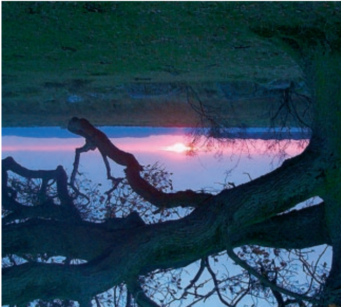
Skejten ved solopgang.

I skovbrynet findes to udsigts- og spisepladser med fin udsigt til markerne mod Skejten.